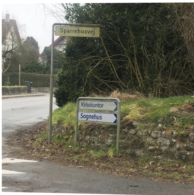
Vi har fået et nyt vejskilt på Sparrehusvej i Tvede, som viser vejen til Sognehus og Kirkekontor.

Venlig hilsen Tvede-Linde-Mellerup menighedsråd